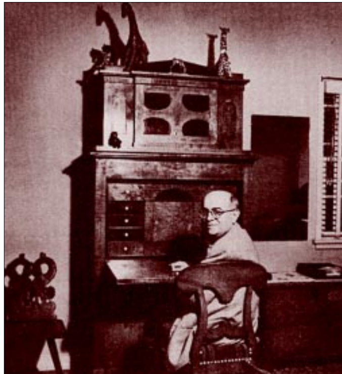
Theodor W. Adorno an seinem Schreibtisch in den vierziger Jahren. Hier formuliert er: „Die Kraft zur Angst und die zum Glück sind das gleiche.“

The year 2001 is the 50th anniversary of the publication of Minima Moralia by the philosopher and sociologist Theodor W. Adorno. This collection of aphorisms is Adorno's most personal book. And this is perhaps the reason that these diary-like notes became a bestseller with a total of more than 100,000 copies sold. Minima Moralia consists of inner dialogs that reflect the central themes of our epoch: the horror of Auschwitz, the degeneration of the individual in the bureaucratic world, the omnipotent influence of the culture industry. Adorno's reflections also touch on existential questions like happiness and love, utopia and hope.