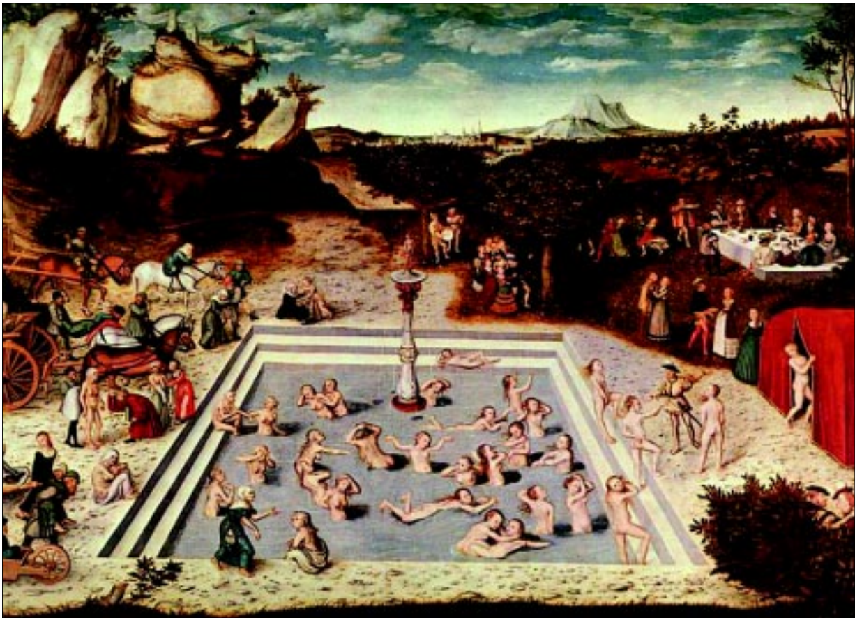
Ein alter Menschheits- traum als physikalische Realität? Lukas Cranachs „Jungbrun- nen“.

Maß dessen, was die Quantenmechanik erlaubt. Es muss also entweder irgendwo ein Fehler sein oder die Quantenmechanik verlangt, dass rechts auch 50 Prozent in jeden Kasten fallen. Damit wäre ein Weg gefunden, wie eine Messung, die links stattgefunden hat, mit Überlichtgeschwindigkeit rechts einen messbaren Effekt verursacht.