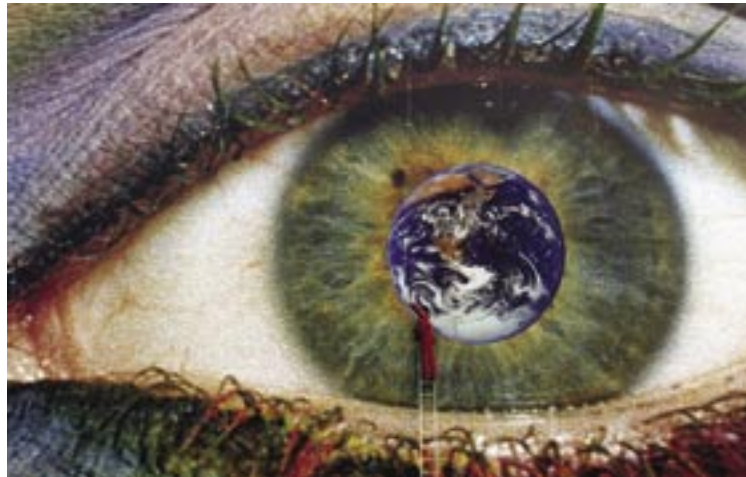
Menschliches Handeln und Nachhaltigkeit: globale Zusammenhänge im Blick?

Das Konzept der Nachhaltigkeit erfordert umfassende Lern- und Veränderungsprozesse. Diese sind allein durch staatliche Vorgaben nicht zu erreichen. Daher stellt sich die im GELENA-Projekt untersuchte Frage, inwiefern andere gesellschaftliche Akteure in der Lage sind, diese Veränderungen in die Wege zu leiten.