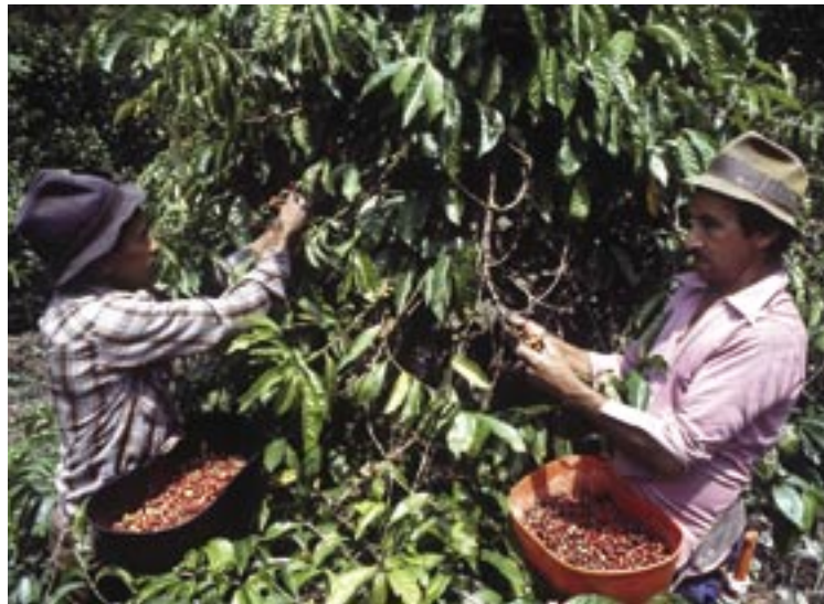
Waren auf kürzestem Weg vom Erzeuger zum Verbraucher: Kaffeeernte im Rahmen von Fair Trade.

Die Umsetzung der Nachhaltigkeit erfordert in hohem Maße Innovationen in den verschiedensten Bereichen. Hierbei ist nicht allein an technische, sondern vor allem