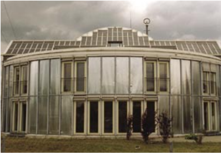
Exklusiv und funktional: Niedrigenergiehaus.