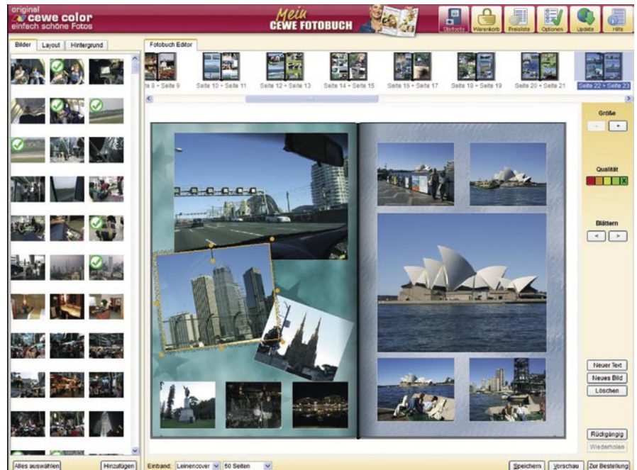
Die Software macht es möglich: automatische Hintergrundwahl im digitalen Fotoalbum.

Eine Herausforderung bei der automatischen Gestaltung von Fotoalben ist die oben angesprochene automatische Auswahl der Fotos. Dieser Schritt kann teilweise mit Hilfe der generierten Metadaten automatisiert werden. Zunächst stellt sich aber die Frage: Welche Fotos sind die besten? Bei unserem Ansatz gliedert sich die Auswahl der Fotos in verschiedene Schritte: Zunächst werden alle Fotos nach bestimmten Kriterien (z.B. Zeit, Personen oder Ort) zu Clustern oder so genannten Mini-Alben zusammengefasst. Davon ausgehend können pragmatisch zunächst die Bilder aussortiert werden, die üblicherweise als nicht gelungen gelten, da etwa die Belichtung nicht stimmt oder das Bild unscharf ist. Dabei muss darauf geachtet werden, dass mindestens ein Bild pro Mini-Album erhalten bleibt, da der Nutzer in der Regel jedes Ereignis dokumentieren möchte – und sei es mit einem qualitativ schlechten Bild. In einem weiteren Schritt können Fotos entfernt werden, die sehr ähnlich zu zeitlich benachbarten sind. Häufig kommt es vor, dass mit einer Digitalkamera mehrere Aufnahmen von einem Motiv gemacht werden, um sicherzugehen, dass mindestens eine gute dabei ist. Aus einer solchen Reihe kann jeweils das beste Foto (in Bezug auf Belichtung und Schärfe) ausgewählt werden. In unseren Arbeiten werden bereits ver-