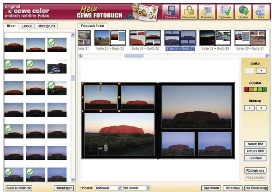
Automatische Vorauswahl von Bildern: schwere Entscheidungen leicht gemacht.

schiedene Kriterien eingesetzt, um eine automatische Auswahl und Vorschläge für ein Fotoalbum vorzunehmen. Basierend auf den Rückmeldungen der Markteinführung der CeWe Fotobuchsoftware werden wir die Auswahl der Fotos weiter verfeinern und um weitere inhalts- und kontextbasierte Kriterien erweitern.