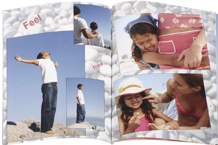
Die schönsten Bilder des Familienurlaubs - festgehalten im Fotoalbum.

Who has not spent hours to creating a nice photo album that carefully captures the impressions of a vacation or celebration: First having prints made, then selecting the best pictures, sorting and organizing them around events and experiences, gluing the photos into the album and labeling them - a tedious and time-consuming task. In cooperation with the regional industry partner CeWe Color scientists at the Institute for Information Technology OFFIS and the University of Oldenburg develop concepts for a new photo album software that relieves customers from these tasks and guides through the selection and arrangement of photos in his or her personal photo album.