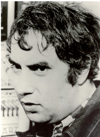
Gilt als Vorreiter der Popliteratur: Rolf Dieter Brinkmann

Er gilt als Vorreiter der deutschen Popliteratur: der in Vechta geborene Schriftsteller Rolf Dieter Brinkmann (1940-1975). Sein Werk steht im Mittelpunkt der Tagung „Neue Perspektiven auf Rolf Dieter Brinkmann: Orte – Helden – Körper“, die das Institut für Germanistik vom 12. bis 14. Juni veranstaltet. Brinkmann, der von der Literaturszene des nordamerikani-