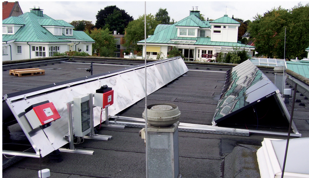
Photovoltaik-Leistungsvergleich: Die erste der geplanten sechs Solaranlagen auf dem Stadthaus Osnabrück.

Physiker untersuchen Energieertrag unterschiedlicher Photovoltaik-Anlagen