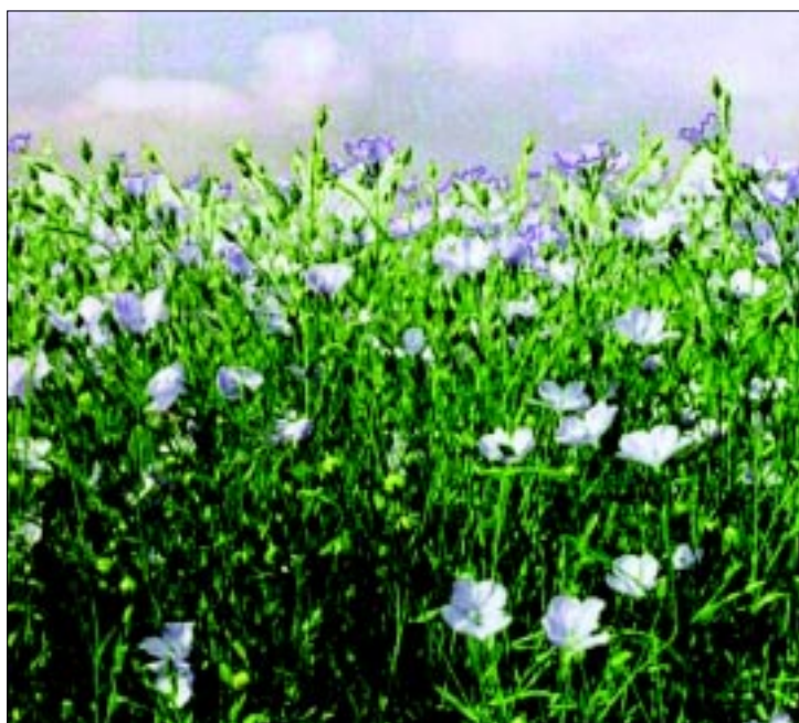
Blühendes Leinfeld (= Flachs): ein Genuss für das Auge und für Insekten, zugleich Quelle des Leinöls, eines nachwachsenden Rohstoffs für die chemische Industrie.

For ecological reasons, emissions of volatile organic chemicals (VOCs) need to be reduced drastically. The development of a VOC-free coating derived from the renewable feedstock linseed oil is outlined, as well as the politically imposed problems concerning innovations for a sustainable development and the need to promote them.