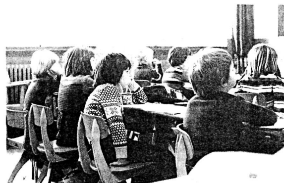
...sondern sie bestimmen das emotionale Erleben und das kognitive Vermögen während des gesamten Schulltags.“