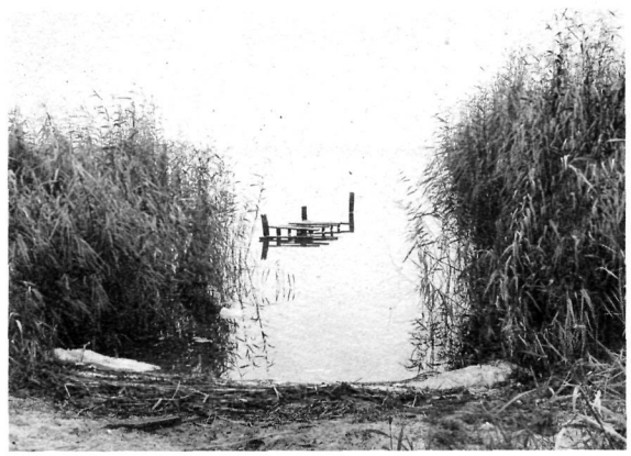
Wird durch Boote und Ratten weiter dezimiert: Röhricht im Zwischenahner Meer.

Billig würde die Rettung des Röhrichts im Zwischenahner Meer nicht, denn sowohl die Verminderung der mechanischen Belastung wie auch Verringerung des Nährstoffeintrages können nicht ohne schwerwiegende Konsequenzen durchgeführt werden. Die Forscher schlagen deshalb vor, die Uferbereiche ökologisch konsequent zu sichern, die Bootszahlen zu begrenzen (900), die Stege zu reduzieren und den Uferbereich zu reinigen. Die Bismarratte sollte weiterhin intensiv gejagt werden. Im Hinblick auf die Wasserqualität bleibt für die Forscher schließlich „eine Totalsanierung möglicherweise unumgänglich“. Sie fürchten, daß dafür nur noch eine Entfernung der nährstoffreichen Sedimentschichten in Frage käme, da die Einleitungen in den See dazu geführt haben, daß der Boden - selbst bei einer Reduzierung der Nährstoffzufuhr aus Landwirtschaft und Kläranlage - z.B. mit Phosphat schon so „gespeichert“ ist, daß er sich nicht mehr mit seinen eigenen ökologischen Mitteln regenerieren kann.