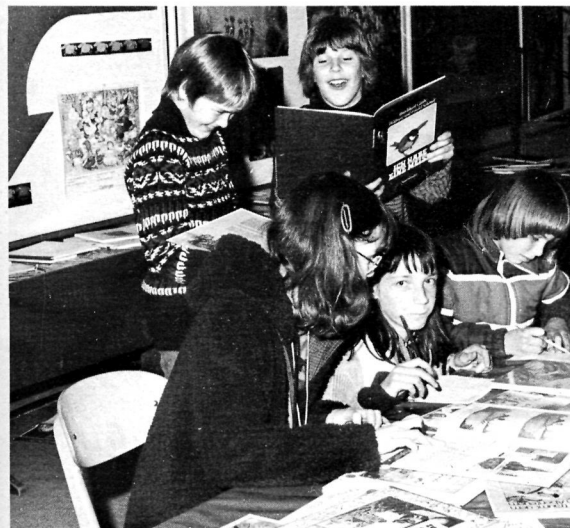
Anziehungspunkt tausender Kinder: Oldenburger Kinderbuchmesse