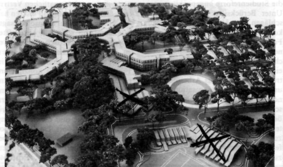
1700 Studienplätze für Biologen, Chemiker, Physiker und Mathematiker: Modell des Projektes in Wechloy. Die dort auch vorgesehene Sporthalle (unten) und eine weitere Mensa fielen allerdings dem Rotstift zum Opfer. Der Sportplatz wird gebaut.

Lautstark protestierte der AStA gegen das „Nein“ der Hochschulbaugesellschaft (HBG), einen studentischen Vertreter mit in die Rednerliste beim Richtfest in Wechloy aufzunehmen. Die HBG als Veranstalter des Festes begründete ihre Haltung damit, daß es nicht üblich sei, bei diesen Anlässen Studenten zu Wort kommen zu lassen. Daß der AStA beim Richtfest des Universitäts-Zentrums am Uhlhornsweg habe sprechen können, sei eine Ausnahme gewesen.