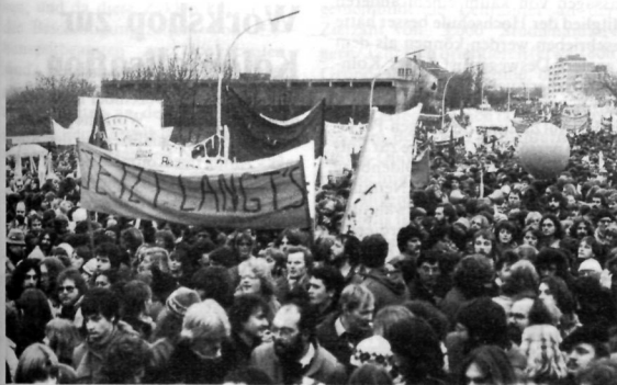
ÜBER 700 STUDENTEN der Universität Oldenburg nahmen am vergangenen Wochenende an der Demonstration gegen die Pläne der Bundesregierung teil, die Ausbildungsförderung nach dem BAFÖG für Studenten auf Darlehnsbasis umzustellen und für Schüler ganz zu streichen. Der Verband Deutscher Studentenschaften hatte zu der wohl größten Studenten- und Schülerdemonstration in der Geschichte der Bundesrepublik aufgerufen. Etwa 70.000 Menschen versammelten sich in Bonn.

Am 26. und 27. Januar werden Professoren, wissenschaftliche Mitarbeiter, Studenten und nicht-wissenschaftliche Mitarbeiter ihre Vertreter für das Konzil, den Senat und die Fachbereichsräte wählen. Bis zum 11. Januar müssen dazu die Listen der hochschulpolitischen Gruppierungen mit den Wahlvorschlägen im Wahlbüro (Bauteil A, Zimmer 204) eingegangen sein. Für Wahlvorschläge sind Formblätter zu verwenden, die dort erhältlich sind.