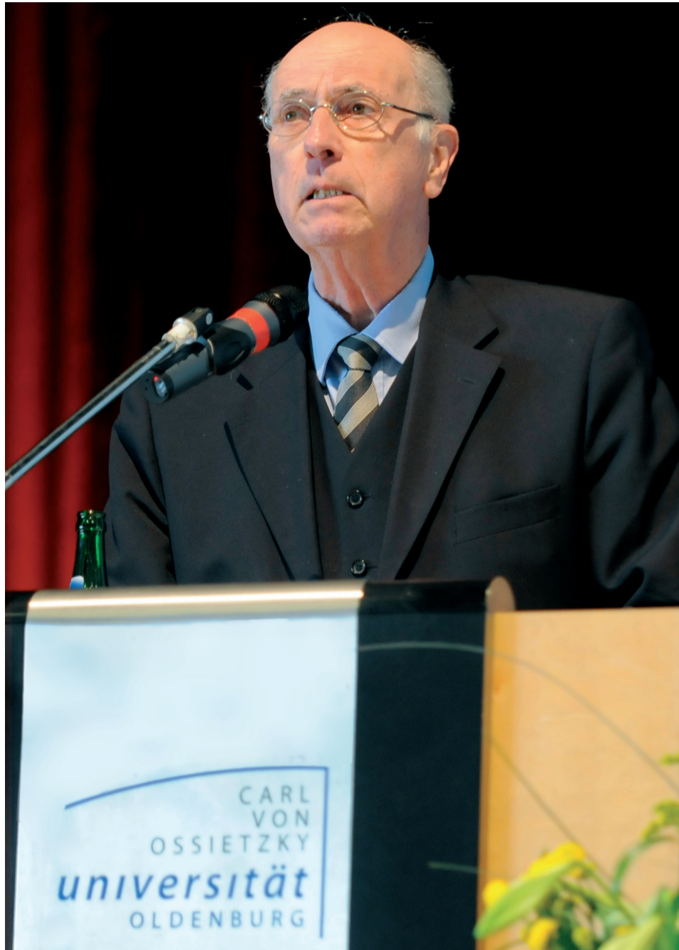
Wolfgang Frühwald: „Lehrerfolge sind in einer ‚Bluffgesellschaft‘ nicht gefragt.“

Die Quantität des täglich und stündlich erarbeiteten Wissens überschreitet inzwischen das Fassungsvermögen auch hoch spezialisierter Forscherinnen und Forscher bei weitem. Wir zählen derzeit weltweit rund 140.000 wissenschaftliche Zeitschriften; die Zahl der auf der Erde in wissenschaftlichen Berufen tätigen Personen wächst jährlich um etwa 350.000, mehr als 120.000 Dissertationen (auf Ph.D.-Niveau) werden pro Jahr weltweit abgeschlossen. (...) Wissenschaft ist heute eher als ein Prozess, nicht so sehr als die Leistung von Einzelnen zu denken, ihre Vermittlungsformen sind entsprechend kompliziert. Allerdings scheint sich hier auch strukturell eine Wende anzubahnen. Horst Kern hat in diesem Zusammenhang darauf hingewiesen, dass seit den siebziger Jahren des letzten Jahrhunderts „in vielen Wissenschaftssystemen die Zahl der großen Wissenschaftsdurchbrüche pro Zeiteinheit nur noch bescheiden, wenn überhaupt“ vorkommt. Das heißt, die Quantität des Wissens wird zwar immer größer, die Innovationsrate aber sinkt. (...)