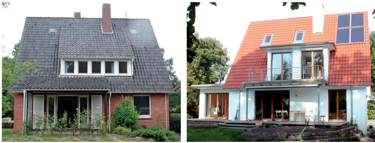
Vor und nach der umweltgerechten Sanierung: Der Gebäudebereich bietet – wie kaum ein anderer Sektor – hohe Energie- und CO 2 -Einsparpotenziale.

Klimaschutzkommunikation: Projekt „GEKKO“ abgeschlossen