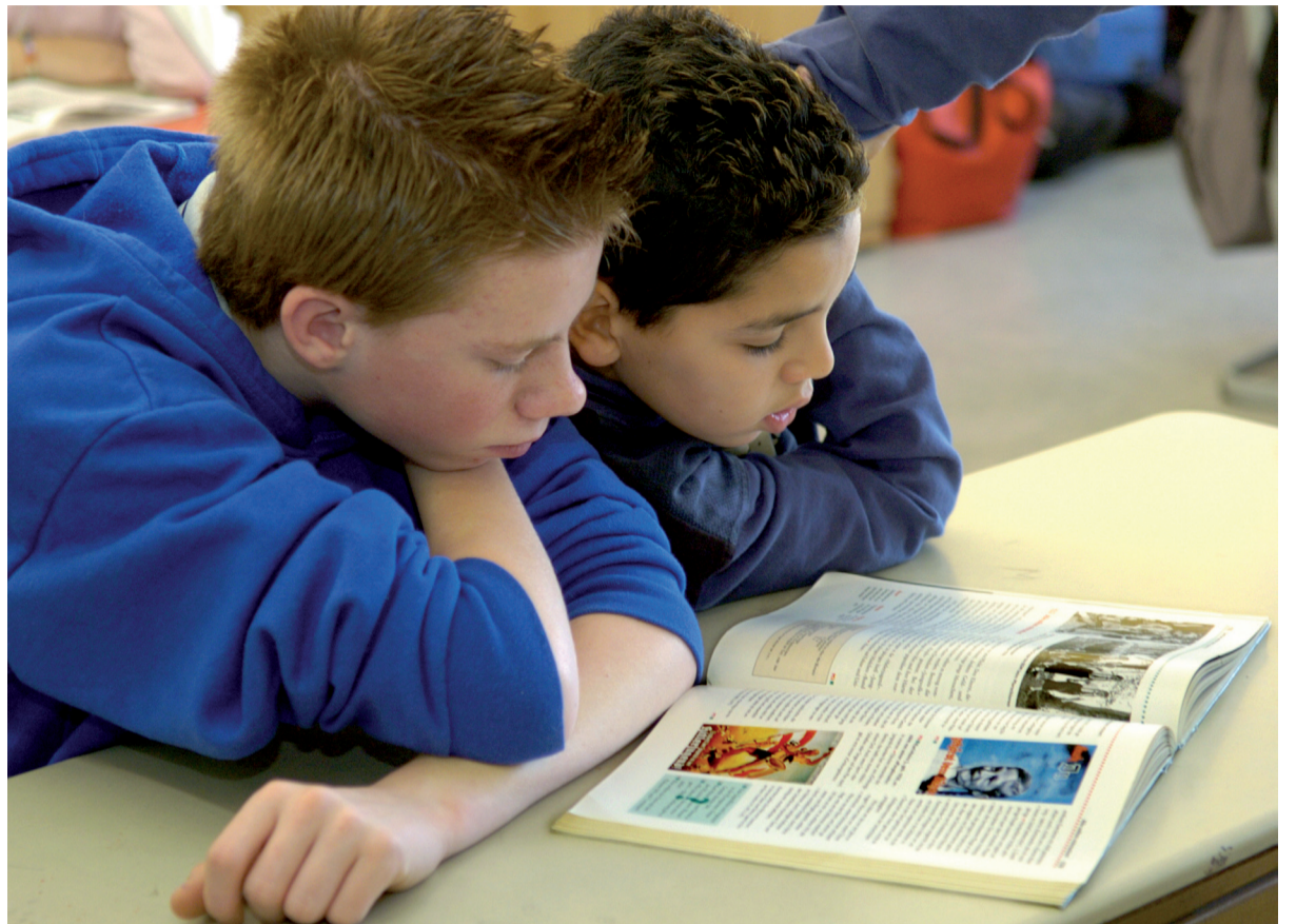
Kinder beim gemeinsamen Lernen: „Es gibt noch viel zu tun, um die Inklusion aller Kinder zu gewährleisten.“

Prinzip der Inklusion in Skandinavien und England schon weit verbreitet