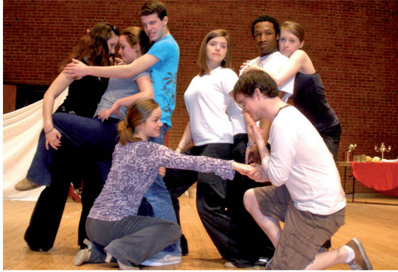
Vielstimmig und verschlungen: Studierende aus Oldenburg und Towson bei der Probe.

Studierende aus Oldenburg und Towson arbeiten an einer eigenen Version des Brechtschen Klassikers „Dreigroschenoper“ / Uraufführung im Mai