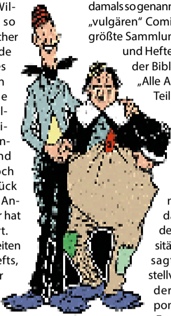
Little Willy and Tired Tim.