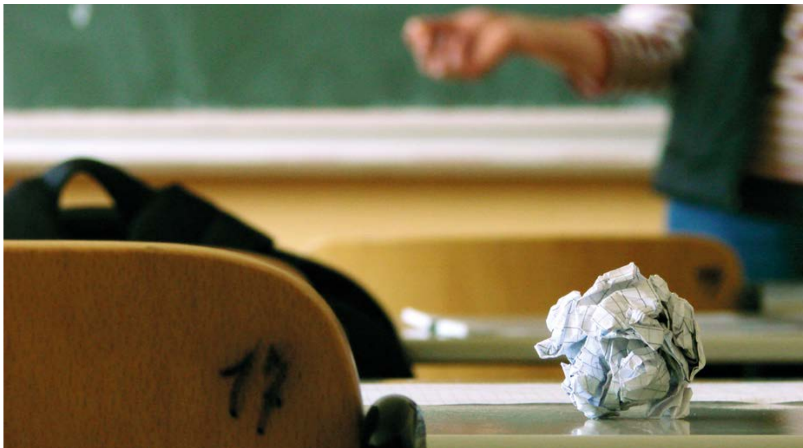
Im Klassenzimmer: „Wie kann Diagnosekompetenz im Einzelnen aussehen?“