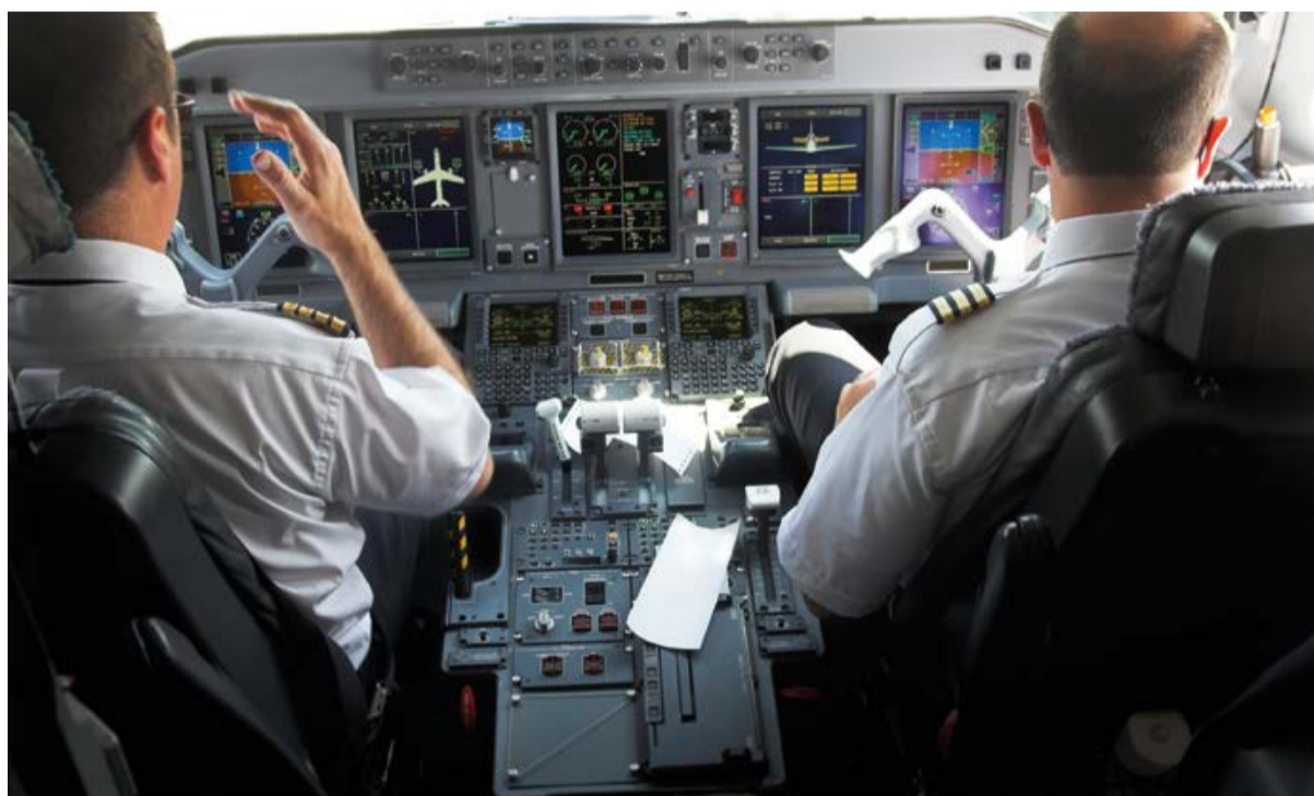
Einsatz Sicherheitskritischer Systeme im Flugzeug: „Hochpräzise Untersuchungen erforderlich.“

Neues Forschungszentrum für Sozio-technische Systeme / Fünf Millionen Förderung aus VW Vorab