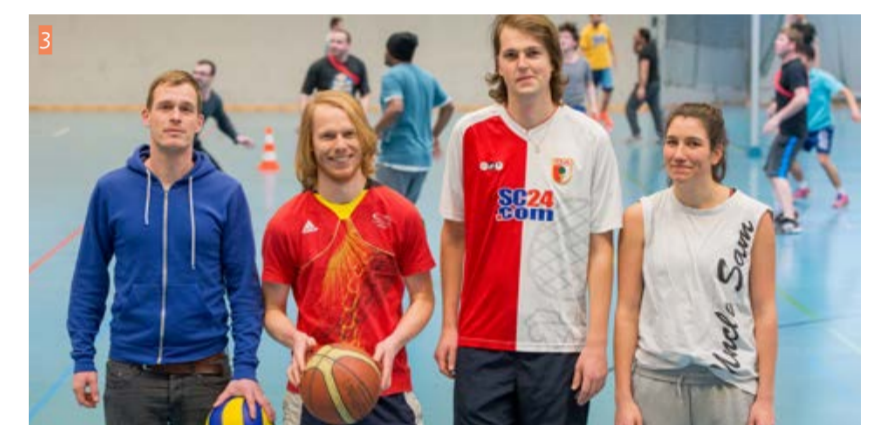
1 Zum Aufwärmen spielen die Teilnehmer meistens eine Runde Basketball.