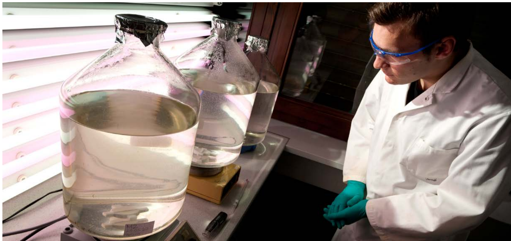
Versuchsaufbau mit den Wasserbehältern, aus denen das Forscherteam vier Jahre lang regelmäßig Proben entnommen hat.

Es ist bis zu 40.000 Jahre alt und als Langzeit-Kohlenstoffspeicher relevant für unser Klima: im Meer gelöstes organisches Material. Oldenburger Meeresforscher haben seine Entstehung untersucht – mit einem mehrjährigen Laborexperiment