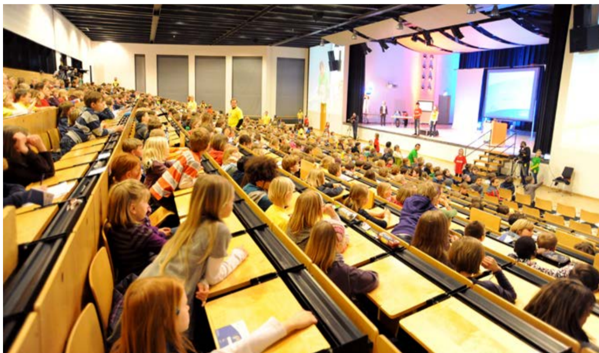
Vorlesungen mit bis zu 800 Kindern im Audimax: Die KinderUniversität Oldenburg.

In einem großen Hörsaal sitzen, Vorlesungen zu spannenden Fragen hören, bei Experimenten mitfiebern und über Anekdoten des Professors lachen – das schätzen die Acht- bis Zwölfjährigen an „ihrer“ Kinderuniversität Oldenburg. Geht es den Kindern dabei in erster Linie um gelungene Unterhaltung? Was nehmen sie mit aus den Vorlesungen? Und haben die Kinder Wünsche an ihre Professorinnen und Professoren? Kinderuniversitäten haben in Deutschland und Europa in den vergangenen Jahren einen großen Zulauf erlebt. Ihre Konzepte sind dabei sehr unterschiedlich – von kleinen Ferienworkshop-Angeboten bis zu Vorlesungen mit 800 Kindern, wie es in Oldenburg der Fall ist. Fundierte Untersuchungen zu Kinderuniversitäten sind jedoch rar. Dies hat mich dazu bewogen, mich in meiner Dissertation „Die Kinderuni im Praxistest“ diesem Thema zu widmen.