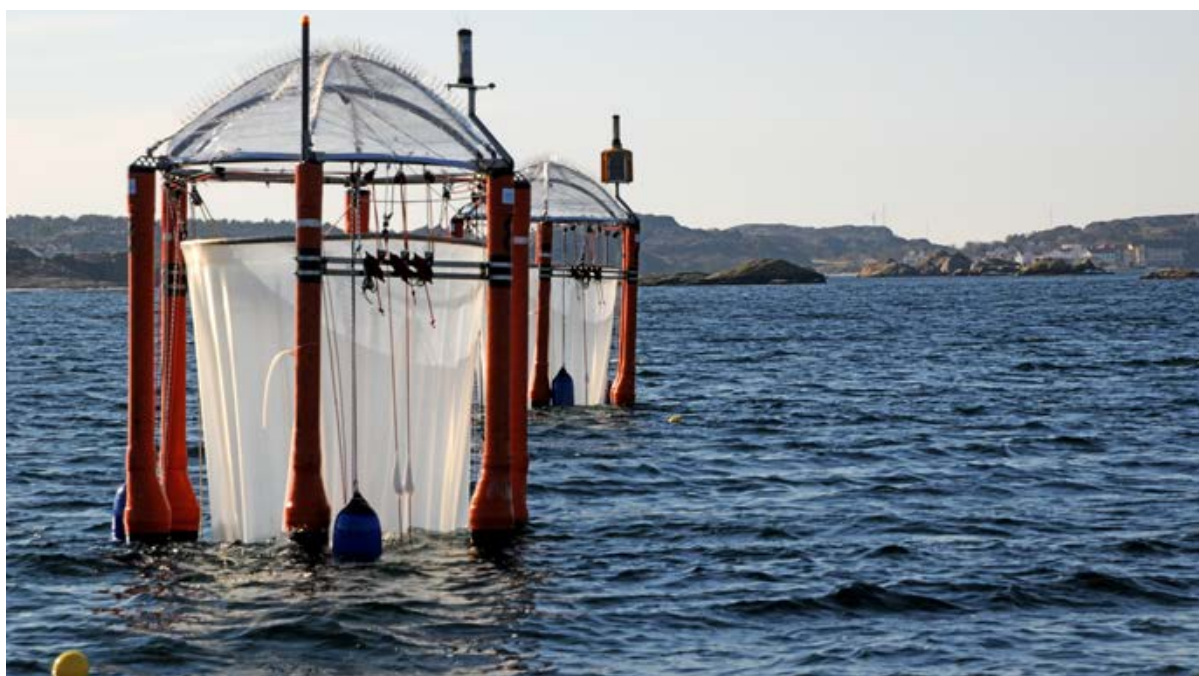
Mithilfe dieser Mesokosmen – riesiger Plastikschläuche, die ins Meer gelassen werden – simulieren die Wissenschaftler den Ozean der Zukunft.

Die Ozeane werden saurer. Was bedeutet das für das globale Klima? Um das herauszubekommen, haben Forscher vor der Küste Schwedens den Ozean der Zukunft simuliert. Ein Team aus Oldenburg war dabei – und erlebte eine Überraschung