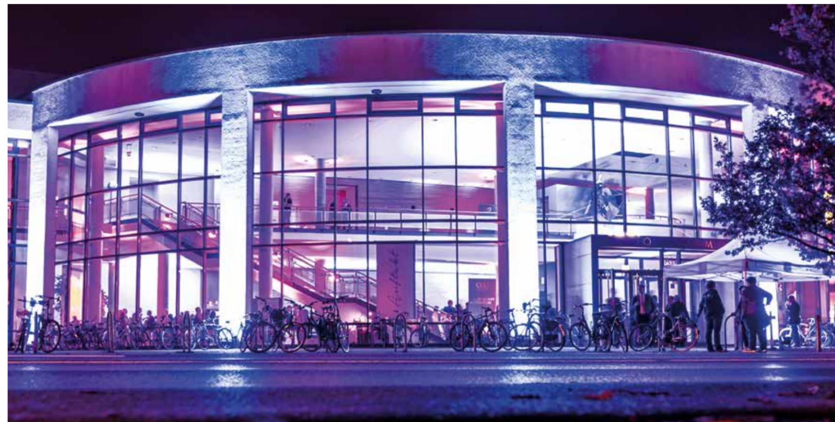
Das Hörsaalzentrum wird in festliches Licht getaucht, wenn Universität und UGO zum „Auftakt 23/24“ einladen.

Mit dem Festakt „Auftakt 23/24“ beginnt im Dezember offiziell das Jubiläumsjahr der Universität. Festrednerin ist die Vorsitzende des Deutschen Ethikrats Alena Buyx. Die Eintrittskarten sind heiß begehrt. Wer noch dabei sein will, muss sich sputen.