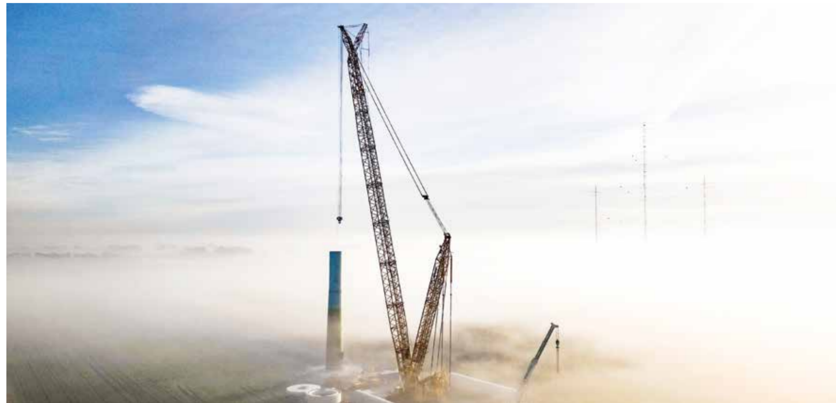
Ein Großkran montierte Stück für Stück die Segmente der großen Windkraftanlagen des Forschungswindparks. Die drei Messmasten im Hintergrund ermöglichen es erstmals, die turbulenten Windverhältnisse zwischen Windturbinen zeitlich und räumlich hochaufgelöst zu messen.

Wie sich mehrere nah zusammenstehende Windenergieanlagen gegenseitig beeinflussen, untersuchen Forschende der Universität im neu eröffneten Forschungswindpark WiValdi an der Elbe.